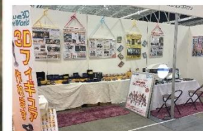
PHOTO NEXT 2017 パシフィコ横浜 CDホール

⇒2017年 フォトネクスト 弊社参加イベント 2日間の開催で≒70~80万の売上でした! 当時は、すべて現金販売でした。